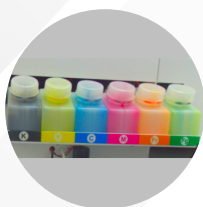
Tanque de tinta