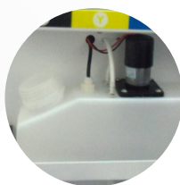
Agitador de tinta branca