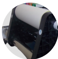
Suporte de bobina